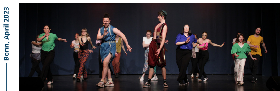
Bonn, April 2023